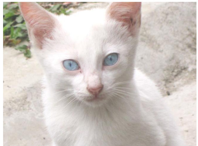
Avis de recherche. On m'a volé mon chaton aux yeux bleus.