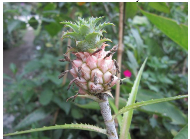
Plante bizarre qui ressemble à un petit ananas. Je n'ai aucune idée de son nom.