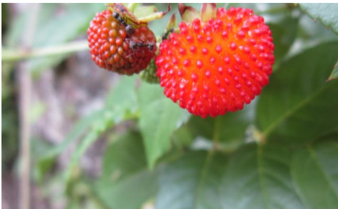
Nos framboises locales. Même les fourmis s'en régalent.