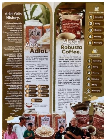
Un exemple de leur travail...Publicité pour le café et l'adlay.

Comme exigence finale de leur cours, ils devaient aussi monter une exposition de produits, ce qu'ils ont fait pendant toute une journée, utilisant les différents produits vendus par SOFA. Ils avaient invité des commerçants et des gens de 2 stations de télévision. Il y a eu des entrevues, des visiteurs de toutes sortes sont venus, en somme une journée bien mouvementée et animée. La photo officielle de l'Expo a terminé la journée. Et quelle joie pour eux de savoir que leur projet avait contribué à leur donner une très bonne note par leurs professeurs. Tout le monde en est sorti heureux.