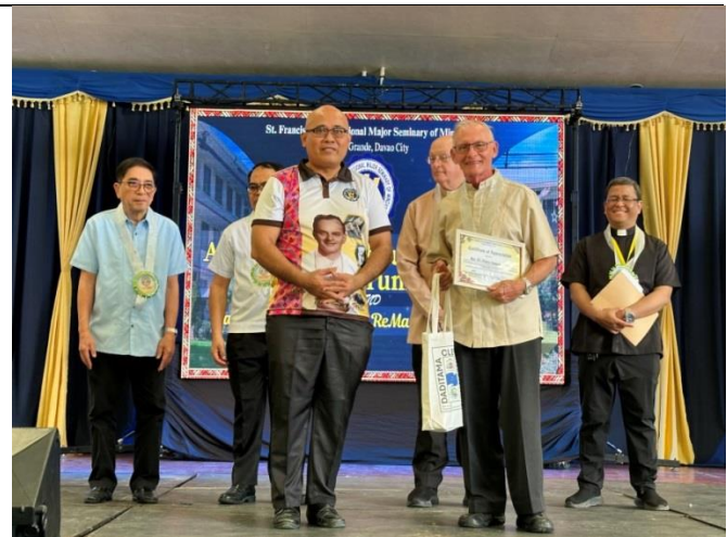
Après le partage, réception d'un cadeau et d'une certification d'appréciation.