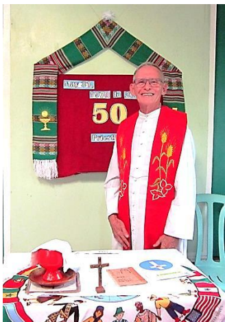
31 mai 2020, à Little Baguio, Pandémie, 12 personnes avec moi.