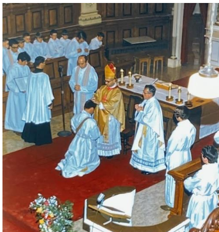
31 mai 1970, à Lyster, par Mgr. Noël, dimanche de la Pentecôte avec grosse assistance.