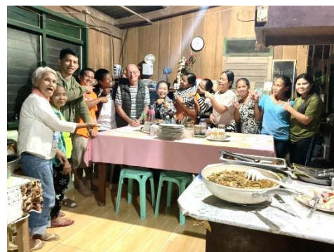
La bouffe nous attend...