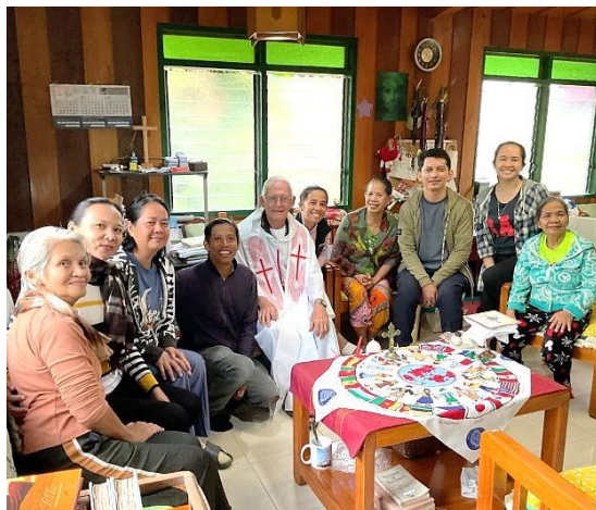
31 mai 2025, à Little Baguio, souligné par la présence de ces chers amis venus aussi fêter avec moi mes 81 ans de vie.

Autre belle journée de célébration le jour de mon anniversaire... On frappait à ma porte à 5:15 hrs pour me souhaiter des vœux, en y ajoutant un gâteau. Avec joie j'ai aussi accueilli plusieurs personnes, en particulier des missionnaires laïques que j'avais accompagnés au début de leur formation. La nourriture ne manquait pas... Nous avons fait la fête sans manquer de remercier le Seigneur pour cette longévité.