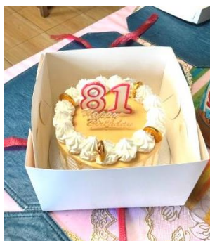
3 autres gâteaux se sont ajoutés à celui-ci

Autre belle journée de célébration le jour de mon anniversaire... On frappait à ma porte à 5:15 hrs pour me souhaiter des vœux, en y ajoutant un gâteau. Avec joie j'ai aussi accueilli plusieurs personnes, en particulier des missionnaires laïques que j'avais accompagnés au début de leur formation. La nourriture ne manquait pas... Nous avons fait la fête sans manquer de remercier le Seigneur pour cette longévité.