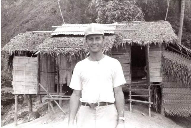
1975 – Paroisse de Caburan Stage d'une semaine dans une famille Blaan