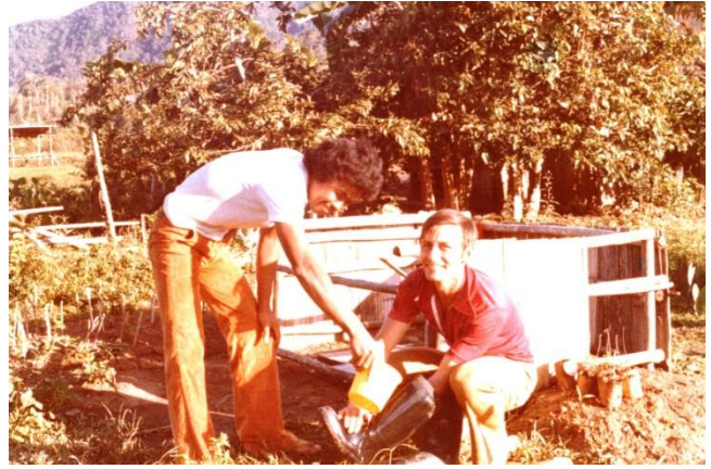
1978 – Little Baguio Notre puit près de ma résidence.