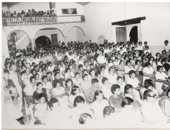
Los asistentes de la Casa de la Cultura. Se nota la cabina de la Radio con sus dos ventanas sobre el balcón en el fondo.

El programa inicial había determinado dedicar cinco episodios para exponer claramente la problemática global de la situación :